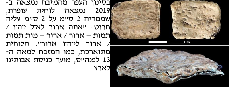
בתמונה: לוחית העופרת ומעמד ברית הר עיבל-הר גריזים. מדובר בכתובת העברית העתיקה ביותר שנמצאה עד כה ותכנה תואם את המעמד.

מתוך פניני הלכה הרב אליעזר מלמד שליט"א בשבוע שעבר: ב - גבולות עולי מצרים ודין סוריה השבוע: ג - ימי חורבן בית המקדש הראשון בעונותינו הרבים גבר החטא, רבים נהו אחר עבודה זרה ולא קיימו כראוי את מצוות השביעית והיובל, עד שהקללה האמורה בתורה החלה להתקיים. מלכי הגויים החלו לגבור על ישראל, עד שבשנת 3,188 לבריאת העולם, תגלת פלאסר מלך אשור הגלה את בני שבט ראובן וגד וחצי שבט המנשה מנחלתם בעבר הירדן המזרחי. מן הסתם רבים מבני אותם שבטים נמלטו לעבר הירדן המערבי, אבל כבר לא היתה להם קרקע. בכך הופר האיזון שבין כל בני שבטי ישראל, העוני גבר, וכבר לא ניתן היה לקיים את מצוות השביעית כראוי. וכן למדנו (בהלכה א), שרק כאשר כל השבטים יושבים על אדמתם, כל שבט ושבט במקומו ואינם מעורבים זה בזה, חייבים מהתורה לקיים את מצוות השביעית, שנאמר (ויקרא כה, ט): "ויקראתם דָּרוֹר בְּאָרֶץ לְכָל יִשְׂרָאֵל" - "בזמן שיושביה כתיקונם ולא בזמן שהם מעורבים" (ערכין לב, ב), והלכה היא שדין השביעית תלוי בדין היובל, וכאשר מצוות היובל התבטלה