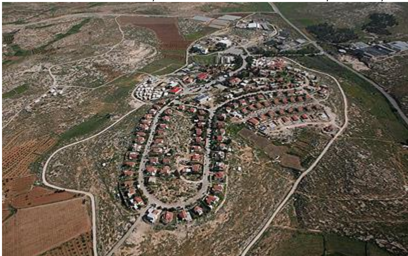
סוסיא - מן האוויר

ההתיישבות הערבית החדשה בין העיר העתיקה לבין הכפר היהודי סוסיא, שחלקה מצוי על אדמות מדינה, הלכה והתרחבה ונוספו עליה משפחות וילדים. הוקמו עוד אוהלים וחושות. מערות קבורה עתיקות פונו הורחבו והוכשרו למגורים, בארות מים עתיקים הוכשרו ונחפרו בורות מים חדשים ועוד. ארגונים שונים הקשורים לאיחוד האירופי הגישו למשפחות אלו סיוע במגוון תחומים כמו: מתקן להפקת חשמל מאנרגיית הרוח, דודי שמש, רכב הסעות, כלי עבודה ועוד. מאז ראשית ההתיישבות הערבית החדשה בשנת 1994 ועד היום, הגישו צה"ל והמינהל האזרחי ביו"ש עשרות צווים לפנויים מאדמות המדינה שהוכרוזו כבר בשנות ה-80 על-ידי משרד הביטחון, אולם ללא הועיל. לאחרונה פנתה עמותת רגבים לבית המשפט העליון בדרישה לבדוק את הנושא, מדוע אין המדינה אוכפת את בעלותה על קרקעות מדינה אלו, ומדוע היא מאפשרת בנייה בלתי חוקית על אדמותיה. מפאת חשיבות הנושא, נקבע שהמדינה צריכה לאכוף את הדין כלפי הפולשים לאדמותיה ומקימים עליה מבנים בלתי חוקיים. בעקבות פסיקה זו הגיעו פקחי המינהל האזרחי לכפר סוסיא הערבי והגישו את צווי הפינוי. אלו כאמור העובדות. לפי ד"ר עקיבא לונדון, מחלקת הלימודי ארץ ישראל וארכיאולוגיה באוניברסיטת בר אילן.